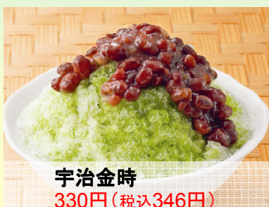
宇治金時 330円(税込346円)