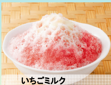
いちごミルク 290円(税込304円)