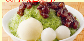
トッピングバニラ白玉 50円(税込52円)