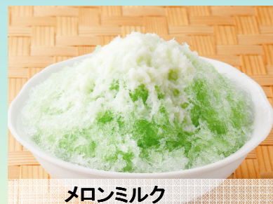
メロンミルク 290円(税込304円)