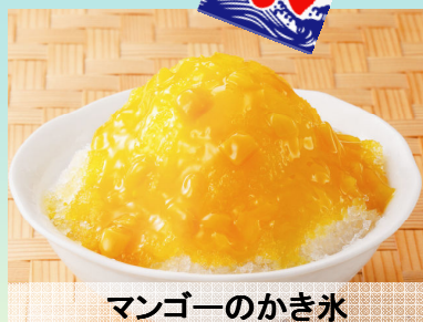
マンゴーのかき氷 290円(税込304円)