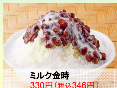
ミルク金時 330円(税込346円)