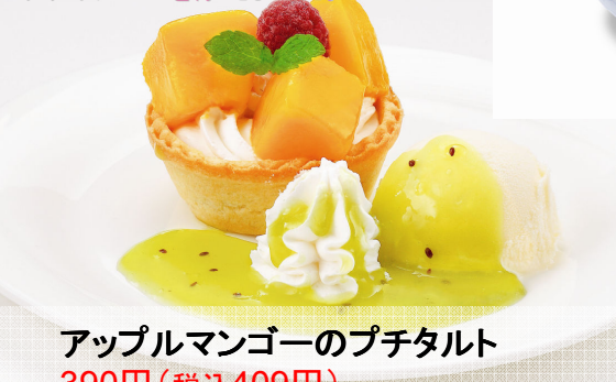
アップルマンゴーのプチタルト 390円(税込409円)